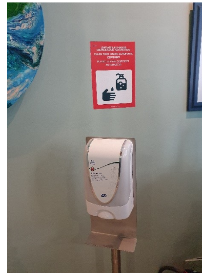
SICHERHEITSPLAN FÜR UNSERE GÄSTE- JUNI 2020